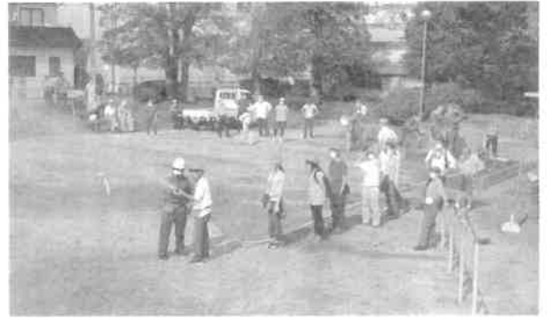
えのきど公園での消火訓練