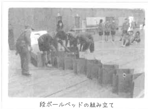
段ボールベッドの組み立て