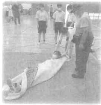
◀毛布による傷病者搬送

生徒達は、段ボールベッドの頑丈さに驚いたり、傷病者を運ぶ難しさを体験したり、訓練担当者に積極的に質問をするなど、熱心に訓練に参加していた。中学校では継続的な防災意識向上を図るため、来年以降も防災教室の継続を計画している。