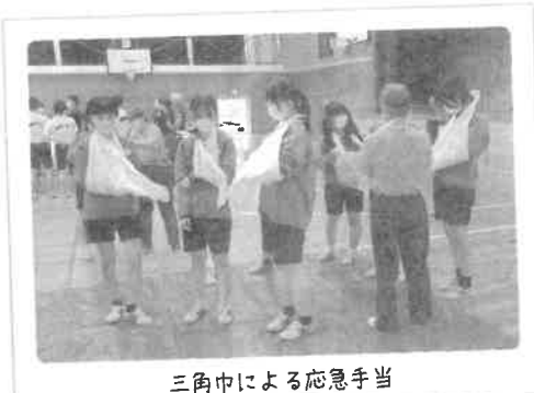
三角巾による応急手当