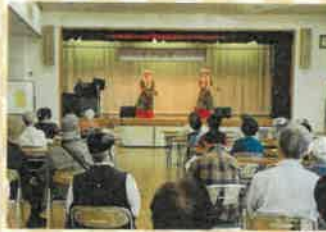
カラオケお楽しみ会