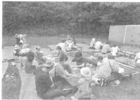
塗り絵・折り紙・紙飛行機・バルーンアートを楽しむ子供達

5月28日(日)、とがしら公園にて子育て世帯を対象とした、新イベントが開催された。当日は16組の親子がイベントに参加した。まずは最初にマジックショーが行われ、驚きの声あり、親子共々ショーを楽しんだ。その後、親子スタンプラリーが行われた。子供達は塗り絵・折り紙・紙飛行機・バルーンアートの作成をしたり、公園内に設置されている4つの旗を周ることで干支スタンプを集め、プレゼントをもらって喜んで帰った。最後に、とがしら夏まつりの提灯名入れの募集も行われた。 婦人部