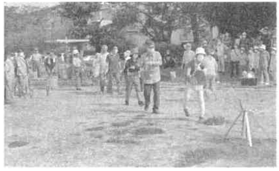
えのきど公園での消火訓練

困り事のお問合せ先：戸頭町会東集会所 電話 0297-78-4200 FAX 0297-84-1205