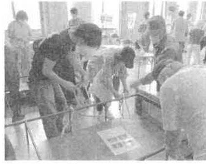
防災教室 訓練①ロープ