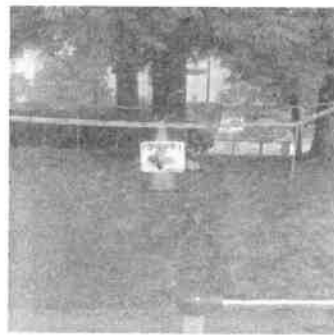
「ハチに注意」の看板と立入禁止の処置

火訓練の際、市から巣が無いと回答を得ている事を説明するも、子供達の安全を考慮し市に業者による再調査の要望が出されました。