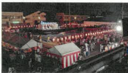
夜の盆踊り会場 大盛況です!!