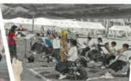
戸頭中学校 (吹奏楽)