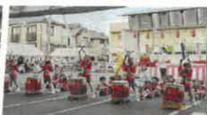
戸頭幼稚園 (和太鼓)