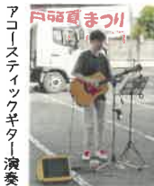
アコースティックギター演奏