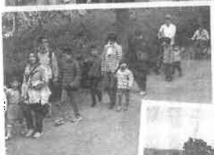
おてつないで親子で参加