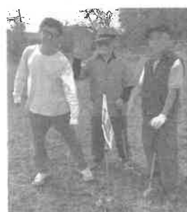
▲広報部長、ホールインワンしました！