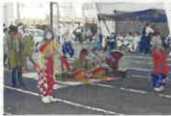
ひょっとこ愛好会