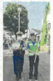
防犯パトロール実施中