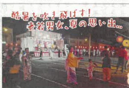
盆踊り会場、盛り上がりました!!