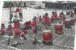
戸頭幼稚園(和太鼓)