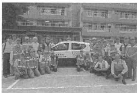
青色防犯パトロール隊（2017年9月20日撮影）

2019年・犯罪統計資料より）であり、住宅侵入盗を防ぐには日々の地道な見回り活動が大切です。