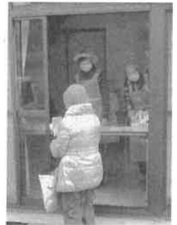
感染症対策を講じての配布

例年、新春に東集会所にて開催されていたもちつき大会は、コロナ禍で3密となることが想定されたため、本年度は事前申込者への紅白餅の配布のみとなりました。 127組の申し込みがあり、1月11日(月・祝)に配布が行われました。