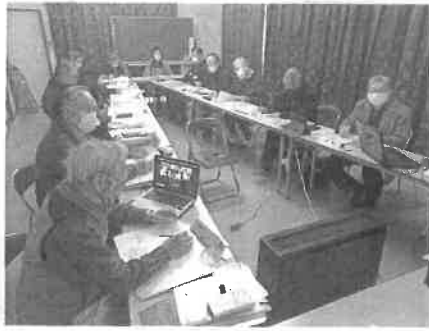
オンライン会議の様子