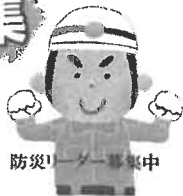
防災リーダー募集中