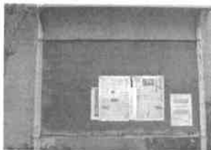
古いボードの状態