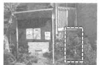
交換後のボード及び枯れ木の伐採後